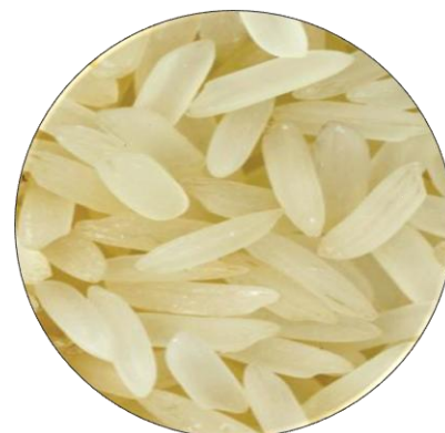
FOTO ARROZ LARGO VAPORIZADO ECO