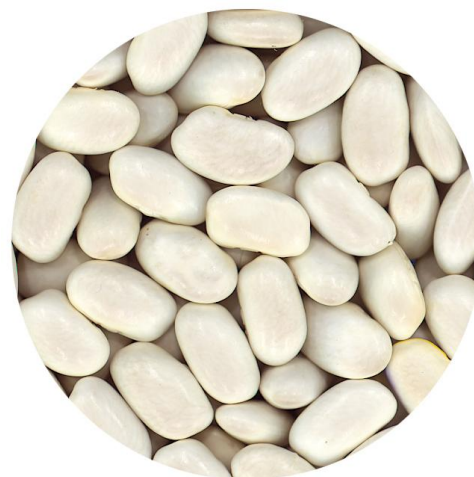
FOTO ALUBIA BLANCA